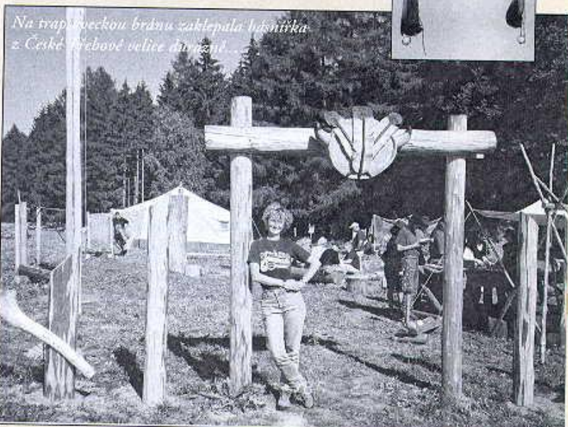
Na trapsaveckou bránu zaklepala básnička z České Třebové velice dávno...