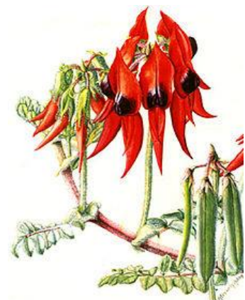
Sturt's Desert Pea neboli Svensona sličná neboli ještě lépe po staru Nádhernice úhledná Symbol Jižní Austrálie